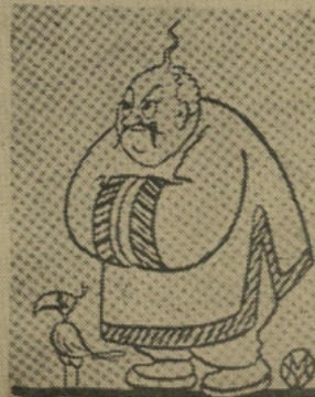
Om Fængselslokalerne, der venter Krigsforbryderen Dr. Best, kan kaldes »bestellers«.